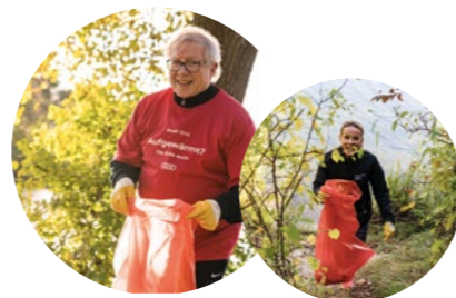
Beim Plogging-Event befreiten 70 Teilnehmende die Strecke rund um den Auwaldsee von Müll.

Unser Herz schlägt nicht nur in den Regionen, sondern auch da, wo Hilfe benötigt wird: Im Juli 2021 verwüstete das Hochwasser viele Gebiete in Deutschland. Die Ausmaße der Umweltkatastrophe lösten im ganzen Land eine Welle der Hilfsbereitschaft aus. Auch die Mitarbeiterinnen und Mitarbeiter der Audi BKK beteiligten sich: Mehr als 12.000 Euro konnten der Aktion „Deutschland Hilft“ übergeben werden.